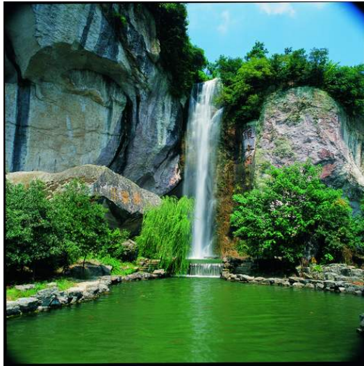
地球的風景很漂亮，但地球人的心很難懂。

雖然我的星球差異不適症已經痊癒，但我對哈馬士的思念卻越來越深，我決定明天開始要走遍地球，將地球的這些風景記錄到觀察日記中，這樣哈馬士也可能會有更多樣的風景，哈馬士神請保佑我。