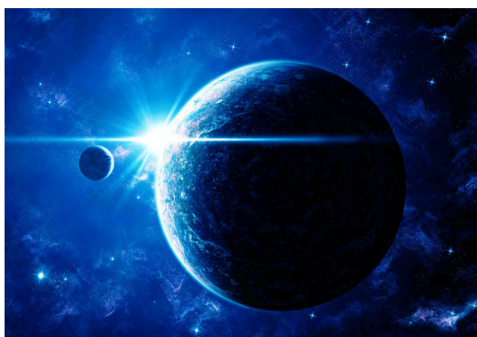
我最愛的哈馬士星球，即使沒有地球的漂亮風景，但我依然愛著哈馬士。

我開始不確定哈馬士的價值到底是不是正確的，還是我之前所厭惡的地球人價值才是正確的，我到底該遵循哪一個？跟他們在一起，我開始覺得在地球的生活好像也不錯，我想我好像沒這麼想念哈馬士，在我違背了那麼多哈馬士準則後，哈馬士神祇會因此而懲罰我嗎？