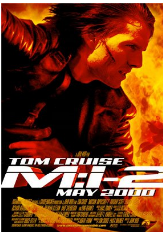
《任務2》海報。

《絕地任務》為動作電影立下里程碑，同時也影響往後動作片的配樂方式。由於好萊塢本身逐漸僵硬的體制，電影劇情一再的複製再造，少了創新嚴謹的故事，只能添加更多的動作場面。但以往重感情的古典樂在這樣的趨勢中顯得格格不入，而漢斯的作品大多節奏感強烈，適合動作場面的配樂，加上《絕地任務》的票房成功，使「漢斯風格」配樂在動作電影中蔚為風潮，之後的《斷箭》、《赤色風暴》、《不可能的任務2》逐漸樹立漢斯在動作電影圈的地位。