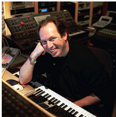
漢斯·季默在工作室中。

漢斯生於德國法蘭克福，在少年時移民到英國，自己成年後則在歐洲各處遊歷，最後才在美國落地生根。漢斯的父親在他年幼時去世，漢斯為了逃避，選擇躲進音樂的世界中。他本身沒有受過正統的音樂訓練，僅在幼年時短暫學習過小提琴，一直到大學接觸到電子樂，才真正邁向他的音樂大道。