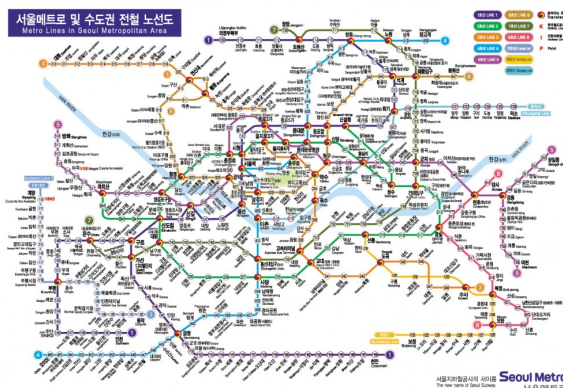
繁複瑣碎、相互交錯的首爾市地鐵圖，連首爾市民也常常搞不清方向而出錯站，更遑論外地遊客。

旅行剛開始總是有礙於面子問題，堅持著所謂「自助旅行」的字義，希望能完全倚靠手邊的資料和地圖在異國暢行無阻，依著文中敘述卻老是遍尋不著景點，因此，五天下來走了好多冤枉路。平常缺乏鍛鍊的雙腿在第二天晚上即發出痠痛的警訊，疼痛和疲累感也日復一日地累積加重，除了睡前抬腿後貼膏藥的緩和動作以外，往後幾天的旅程我們簡直學乖了，「那條路好像可以到欸，要不要去看看？」之類的想法已不復再現，只要一發現和手中資訊有所出入或甚感疑惑，當機立斷隨即攔了路經身旁的路人詢問，不管是韓文、英文還是肢體語言，能問到正確解答的就是好方法！