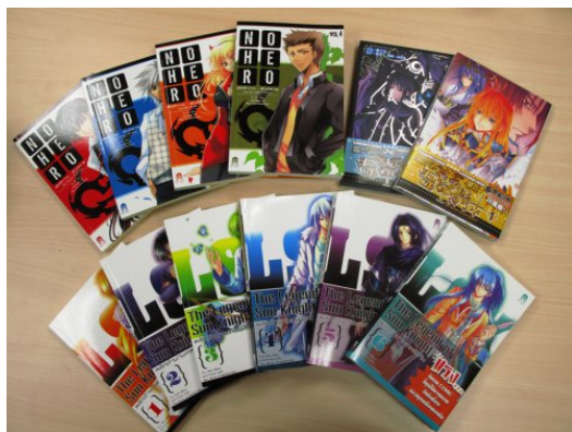
上排左起為四本泰文版《非關英雄》，右兩本為香港漫畫版《吾命騎士》， 下排為泰文版《吾命騎士》。