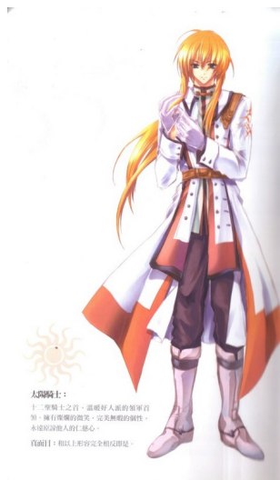
主角格里西亞。此為附在小說第四集中的人物設定彩頁，由封面插畫家亞砂繪製。

身為第三十八任太陽騎士，主角格里西亞被譽為是最接近「傳說中太陽騎士」形象的一個，但事實上，他除了金髮藍眼以外的一切都是訓練出來的。容易曬黑的他必須經常敷面膜美白，遇見美女也只能偷偷欣賞不能追，而為了維持三杯倒的形象，他還被老師逼著練習喝酒直到跟喝水沒有兩樣。格里西亞不喜歡出門、更不喜歡開口說話，因為只要在公開場合，他就得隨時保持優雅和微笑，並且不斷歌頌光明神。而且，他的劍術和馬術都非常糟糕，如果按照傳統對騎士的形象來看，光這兩點就完全不及格，何況他還經常使用陰損的小手段，並不是一個正直騎士該有的行為。