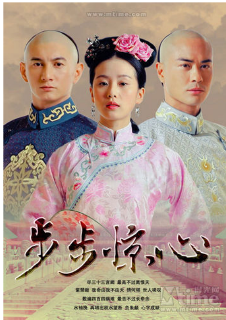
2011年首播的《步步惊心》，在穿越風潮較為平息之時，再度引起熱烈的討論。

然而台灣在穿越時空的創作上略顯遜色，並不像中國大陸或日本的創作那麼多。在電影方面，較為人所知的是《不能說的秘密》；而小說方面，則是以言情小說為主的創作較多，除此之外，台灣並沒有廣為人知的穿越時空創作，大多採取引進的方式，在這一方面略顯可惜。