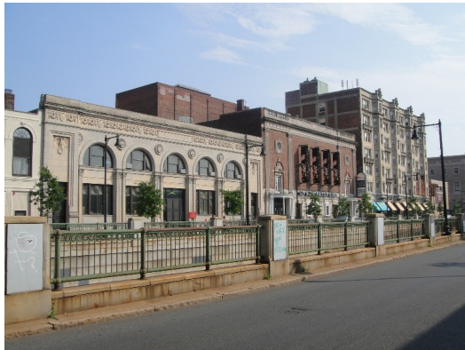
漫步在波士頓，最初能明顯感受到的就是整齊寧靜的街景以及隨處可見的紅磚色建築，一切都如此井然有序。

身為美國最古老的城市之一，波士頓不僅散發了濃厚的人文氣息，也擁許多極具歷史意義的建築。走在波士頓的古老街道上，試著傾聽這座訴說百年故事的城市，並呼吸著不一樣的空氣。