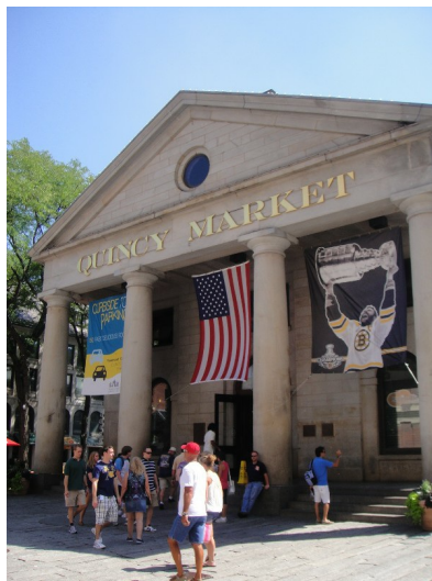
昆西市場（Quincy Market）販售各種熟食，周圍有許多店家及酒吧，因此白天總是人來人往，晚上也十分熱鬧。