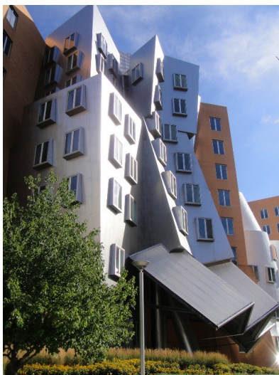
麻省理工學院裡的建築物充分展現學校在工程、科學上的長才，不規則的線條及鮮明的顏色，都讓人眼睛為之一亮。