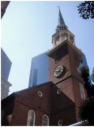
波士頓以大學、歷史建築為主要的觀光景點。在歷史建築中，教堂佔了絕大多數，有的仍在使用，有的則開放參觀。