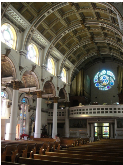
若逛累了，或許可在百年的老教堂中坐上一會兒，感受靜謐的氛圍，並讓身心沉澱。