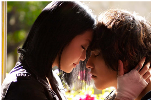
阿豪與小影的愛情引人入勝，卻稀釋了音樂在《電哪吒》中的主體性。