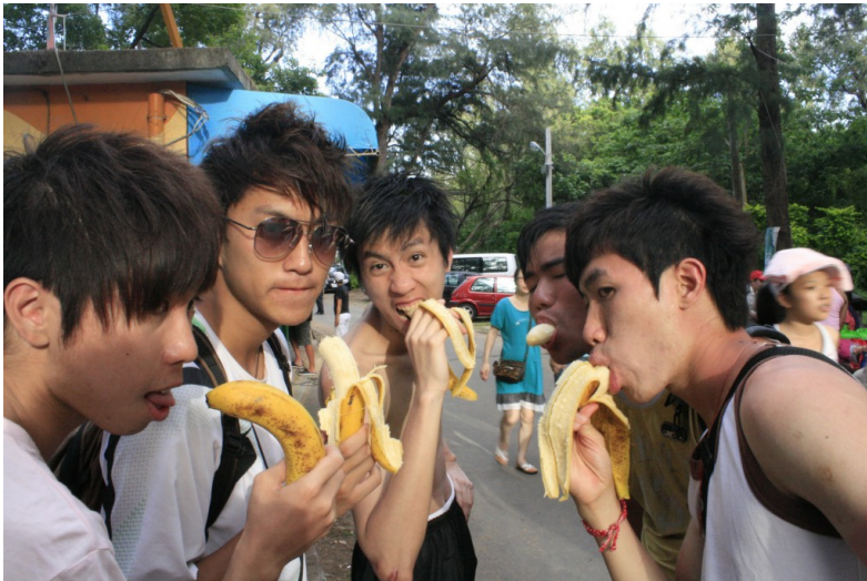
重點不是做什麼，而是跟誰過。

但這可不是松浦先生書中所提及的「生活」。生活是用心去體會，才會過得有意義。要珍惜每一天，首要條件是過得充實，時常保持好奇心，讓每天都有新發現，才不會有略有所失的空虛感。智慧型手機的確方便，但這種方便卻扼殺了空間多餘的時間，身邊再好的風景也只會是走馬看花。悠閒的光陰正好是城市人需要的養分，如果等候的時間要靠手機程式來度過，倒不如關心身邊那些平凡又可愛的人事物。