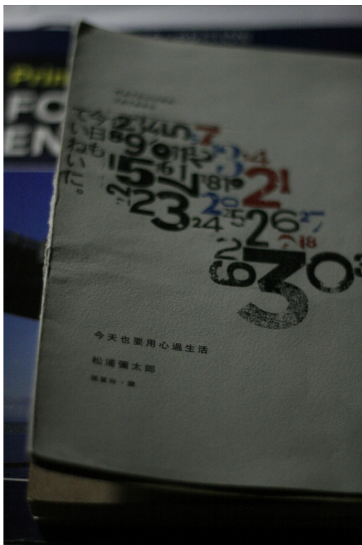
簡單的封面設計令人感到十分舒服。