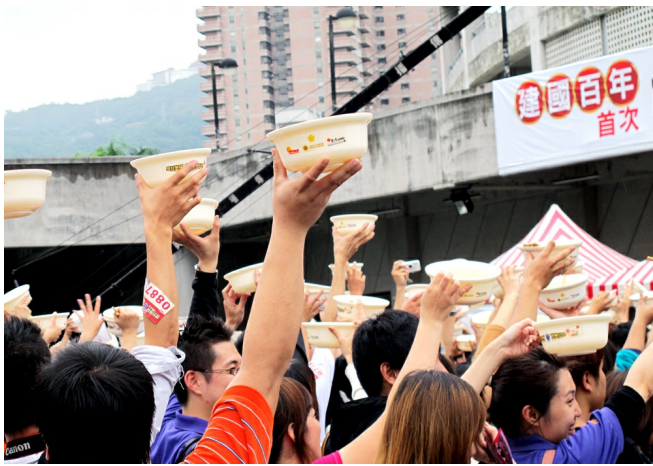
第二項紀錄挑戰成功，大家一起把碗舉向空中，證明已完食。