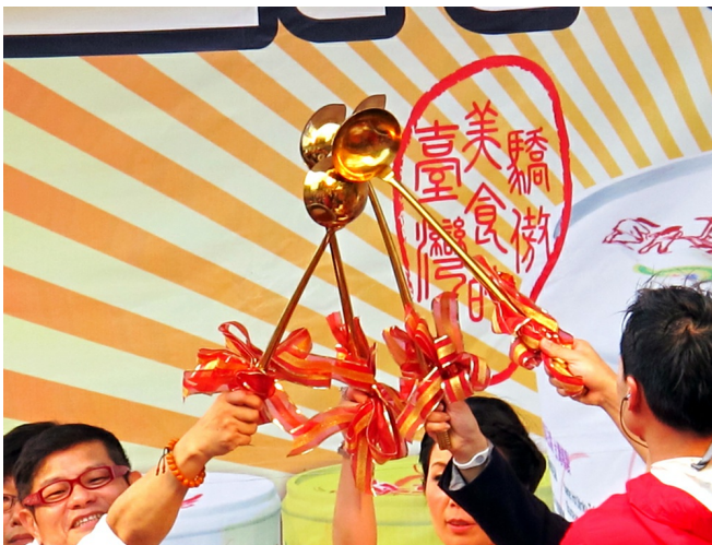
以金湯匙食用臭豆腐宣布第二項紀錄挑戰開始，臭豆腐先裝成一桶一桶，再分碗給每個人。