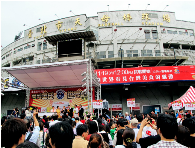
雙料世界紀錄於天母棒球場舉辦，許多民眾熱情參與。

台北市天母商圈，於昨（19）日下午挑戰雙料金氏世界紀錄。在來自英國的金氏紀錄官見證下，同時創下「史上最大臭豆腐罐頭」和「最多人分食臭豆腐」兩項紀錄。此項活動開放網路報名前兩周，即有兩千多人報名。當天雨勢雖大，仍不減民眾熱情，有一千多人參加。