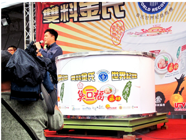
史上最大臭豆腐罐頭，重達1026公斤。