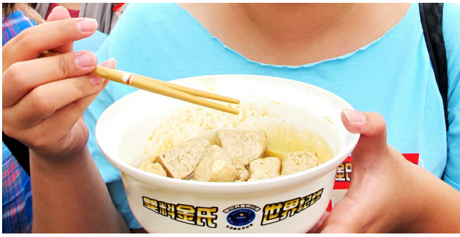
罐頭約裝了三萬塊的臭豆腐，每人皆有一碗，平均一人要吃掉半斤左右的臭豆腐。