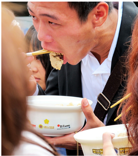
民眾吃得津津有味。