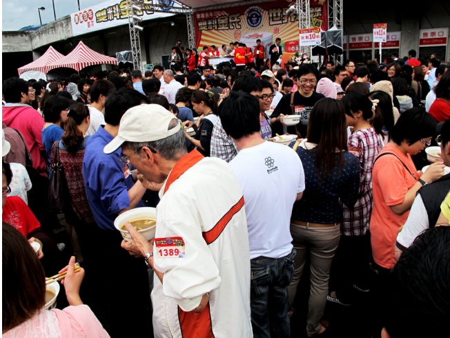
挑戰第二項金氏世界紀錄，最多人一起完食臭豆腐。