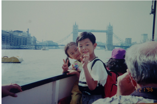
London Bridge，一個讓你最難以忘懷的風景。

你記得你也很喜歡大笨鐘，從「Big Ben」英譯過來的大笨鐘，坐落在倫敦的泰晤士河畔，與其說你是因為它在英國特殊的歷史背景而興奮，不如說你純粹是對那個「笨」字印象深刻而已。現在想起來也許稍嫌愚蠢的幻想，在小時候卻可以那麼理所當然，那個時候，你根本不會講外語，連國字都寫得歪七扭八，但你不需要知道世界有多複雜，你可以很單純地對一個風景念念不忘，就像喜歡一個人一樣，說不出理由，但卻是你最渴望有一天能再回去的地方。