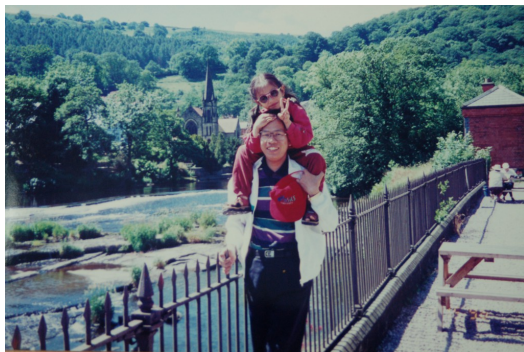
你最喜欢坐在爸爸身上，頓時自己變得好好高，彷彿看得見全世界。（照片來源／林儀 翻拍）

因為爸爸進修的關係，你趁暑假時到英國待了一個月。那是你第一次坐飛機，在機場的時候，你跟哥哥的左右手各被一條塑膠鍊給圈住，連向媽媽和阿姨，就像出門溜狗一樣。身旁通關的叔叔阿姨打趣地對著你們指指點點，但你咧嘴笑得好開心，因為你自得其樂，根本還不懂什麼是世俗的眼光。