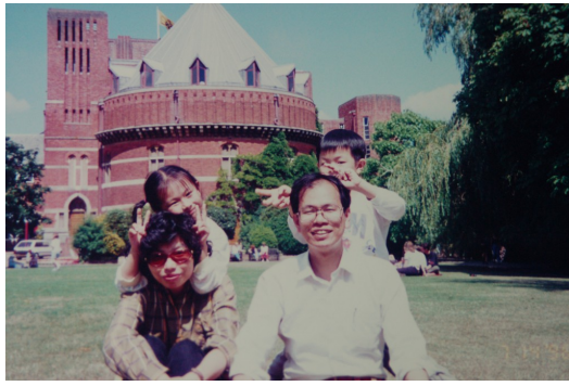
爸爸媽媽帶你們來到皇家莎士比亞劇場與天鵝劇場，享受悠閒的假日午後。