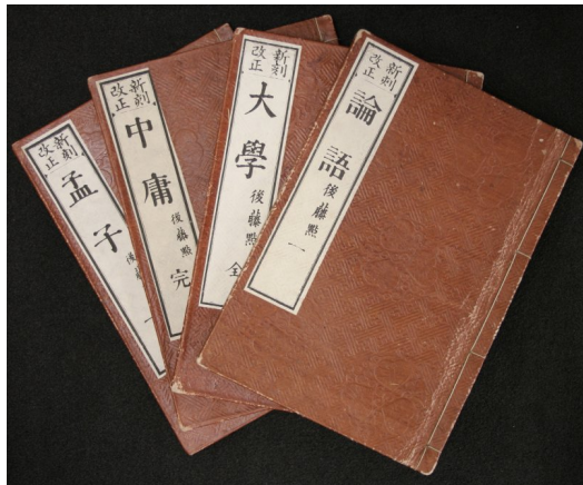
儒家思想經典：四書。

專制獨裁剛好相反，就算打從心底千百個不願意，上位者傳令給底下說該怎麼想、怎麼做、該持何種觀點，下位者毫無反抗能力，只能乖乖接受。如此的情況下，又不是身處非民主體制的國家，何以必定得以中庸之道行事？況且，身為一個自由人，為何不能有強烈的立場？也早有這種說法：儒家思想，這些千年前留下來、早已深植人心的許多觀念、信條，好些對當今社會其實有害而無利！