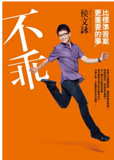
「不乖」的孩子都會被扣上帽子，這是中庸？

從以前到現在諾貝爾獎得主數量的懸殊差異就是很好的例子，在813名獲獎者之中，華人竟然只有10個，這數量上的鴻溝所代表的意義不說自明。不過值得一提的是，雖同樣接受過儒家思想教育的日本，因為較早且積極的推動西化，觀念想法比較貼近歐美，有18人拿到諾貝爾獎，足足比華人世界多了八個，而西化加上民族性，也創造出了好些世界知名品牌。即使儒家教導做人的道理，但讀書卻不能採取這方法，否則一路中庸下去也只會取得平庸的成果。