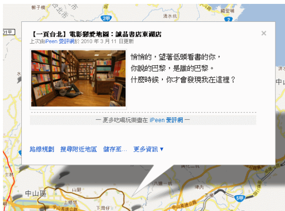
《一頁台北》將電影中的場景放進電子地圖，並加進周圍商家的資訊，此舉不僅方便影迷，對電影及商家都有很好的宣傳效果。

近年來國片開始復甦的轉捩點，或許可從《海角七號》談起。2008年暑假上映的《海角七號》不僅創下了五億三千萬的超高票房，也使電影主要的拍攝地——恆春變成觀光勝地。如劇中男主角阿嘉的家、女主角友子和阿嘉擁抱時所在的沙灘、阿嘉送信經過的橋等，都被墾丁國家公園管理處整理成專屬網站，粉絲如果想朝聖，便可利用這些資源。此外，2010年上映的《一頁台北》則更加善用城市行銷策略。不像《海角七號》是「意外」捧紅許多觀光景點，《一頁台北》一開始就與愛評網合作，將電影拍攝的場景做成電子地圖，不只使用方便，又能結合景點周邊的店家，以創造更多商機，而這個電子地圖也在兩週內創下四萬六千次的瀏覽人數。