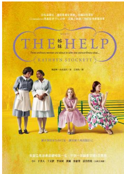
這是中文版電影海報封面，在美國上映即受到廣大迴響