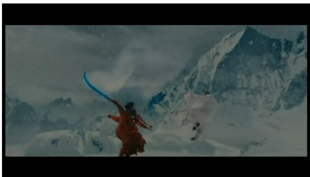
徐若瑄與李連杰打鬥的一幕，依靠特效，令女主角們也能有高超的功夫。

片中有大量特技場面，但其素質參差，大大減低了可觀性。不過特效使女演員們亦能有霸氣的一面，展演妖術的能力。如剛開始徐若瑄所演的雪女與法海的打鬥場面，藉著特效使她的功夫看起來不亞於李連杰。而後面的水漫金山寺那一幕亦令人感到震撼。