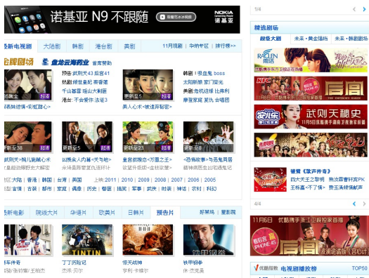
依不同類別的影片分類，網頁包含廣告。

美國網站也會提供最新的影片，但是要觀看的話必須先花錢安裝檔案，或是可以免費收看，但卻有流量限制。只能說大陸人真的太強了，可以讓網路電視如此唾手可得。