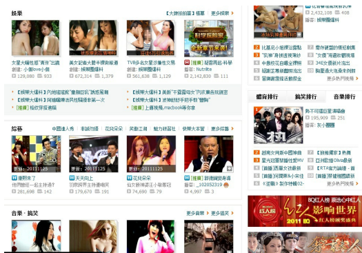
網頁上也有一些兒童不宜的縮圖，分類越分越雜。