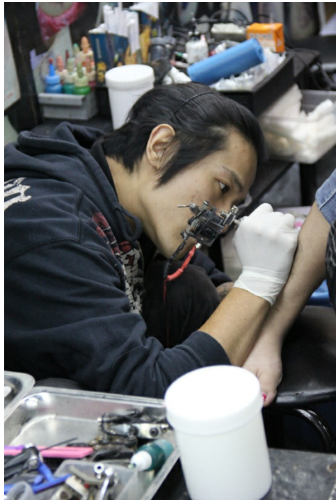
專注的工作神情，宛如畫家作畫般每一筆都馬虎不得。