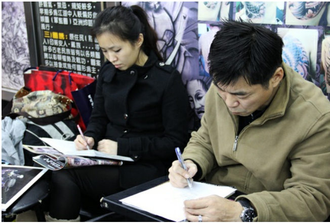
師傅有靈感時隨時拿起紙筆畫下圖案，讓客人能有更多元的選擇。