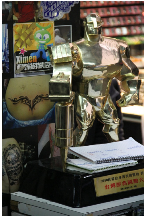
已經連續舉辦兩年的世界刺青博覽會，獲獎獎盃象徵台灣刺青產業正擺脫既有形象，走出新的一片天空。