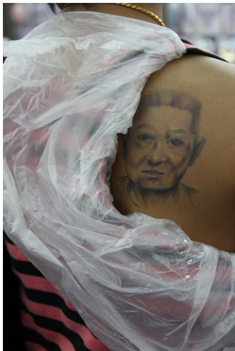
背上這張臉，是陶小姐對爸爸永恆的紀念和懷念。