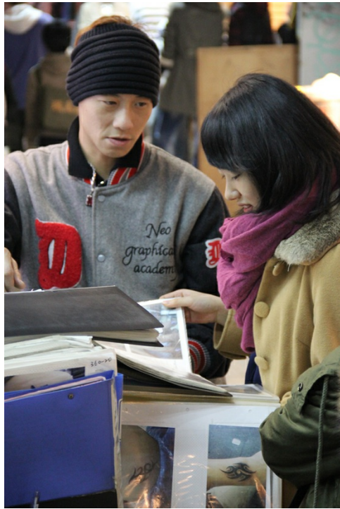
刺青的決定往往需要決心或動力。妙齡女子駐足在店前，正在猶豫著要不要在自己身上留下一個。