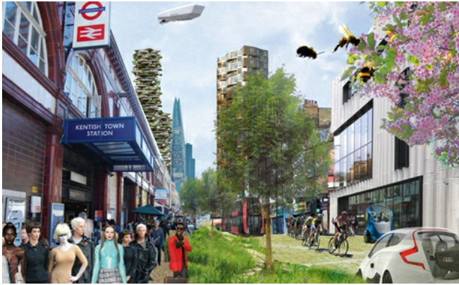
想像2030年未來城市的藍圖，人與建築物的相對關係轉變，將道路使用權還給綠地與行人。

由於都市發展需要創造新的空間，而現在又面臨著能源與土地錙銖必較的時代，花了好幾億元投資，若是最後要反悔拆除也是件難事，興建一棟公共建築需要謹慎地評估優缺點，最重要的是人工建築應讓住民的生活品質加分，在城市中共築一塊綠洲休憩，並期許人造物與大自然的關係邁向融合。