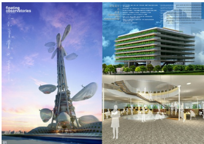
左圖為台灣塔的概念圖，旁邊可活動的葉片與一般印象中的高塔形象很不一樣；右圖為高雄圖書館的懸吊式綠建築，充滿綠地的層狀構造可供民眾休憩。

而另外一棟於今年完成競標的綠建築作品，則為高雄市立圖書館總館。預計明年開始動工的這棟大樓，號稱是全世界第一座懸吊式綠建築（用懸吊式力學撐起每層樓的結構），建築物的外觀同樣佈滿綠地與半透明的建材風格，將公園草地往每一層樓延伸，特殊的層狀結構也使得館內空間看起來更寬闊明亮。非常符合綠建築的理念——建造一個節約能源、讓人感到舒適的空間。