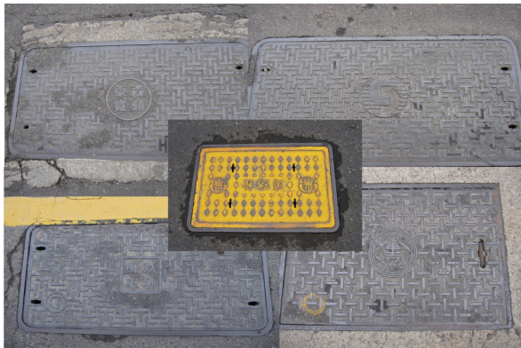
道路路面上處處可見不同機構的人孔蓋。

台灣各地區管線單位常常不時地需要開挖路面，埋設住戶所需之管線，致使道路挖掘現象頻繁，交通因而受到影響，亦給予民眾不佳的觀感。