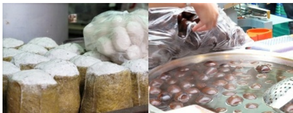
淡水名產阿婆鐵蛋和阿給，是許多遊客的最愛，也是老街的特色之一。