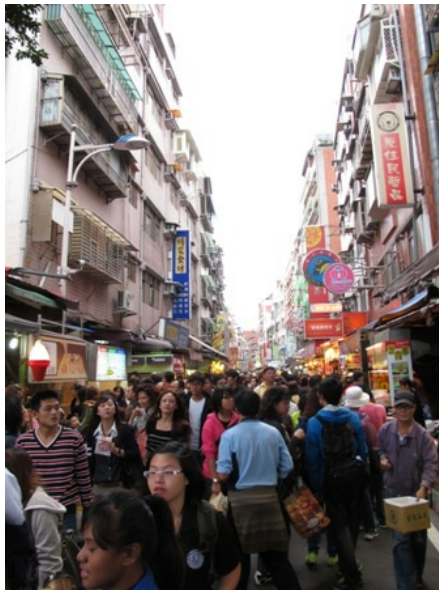
假日的淡水老街，總是擠滿了的旅客。

鄰近捷運站的淡水老街，是假日休閒的熱門景點，每到周末或是國定假日，總是人潮眾多，是許多家庭帶小朋友玩樂和青少年周末和朋友們聚會的地方。走在老街上，可以看見五花八門的商店和各種小吃。除了著名的淡水特產吸引人外，老街旁的渡船頭也是觀光景點之一，捷運站周圍的公園設施也讓這個地方更加完善，不僅僅只是逛老街，公園內的綠地、長椅，都是人們聚集聊天、休息的地方。在這裡可以感受到假日歡愉、放鬆的氣氛，當你有空時，不妨到這裡走一走。