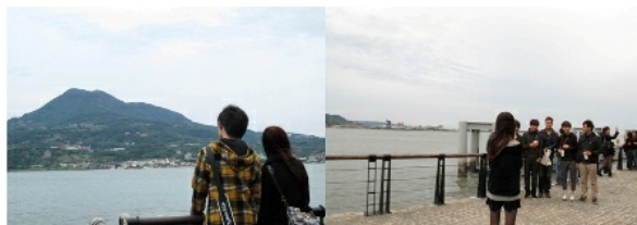
一到假日，有許多的年輕學生會選擇到這裡和朋友聚會，也是許多情侶的約會聖地。