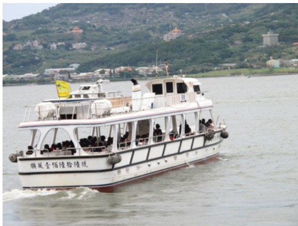
淡水渡船頭，連結到八里渡船頭和淡水漁人碼頭，帶給遊客方便，更可以享受另一種遊淡水的風情。