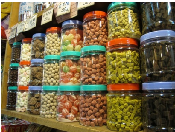
五花八門的商店裡，少不了和老街復古風格相應的復古糖果店，這裡販賣的是許多人酸酸甜甜的童年滋味。