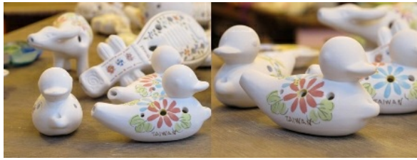
在老街裡，有許多的手工藝品店，手繪的陶笛是其中一，可愛精緻的造型，吸引遊客駐足，也引起外國旅客的注意。