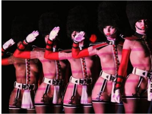
瘋馬女郎上空表演內容引發爭議。

國際知名的法國秀場表演「瘋馬秀」17日在台灣結束演出，表演前台灣媒體爭相報導這個世界級的高規格歌舞秀，然而其中最引人矚目的女體上空表演內容，卻引發各界人士爭議不斷，再度掀起藝術與色情的話題。