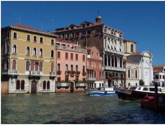
義大利人在談情說愛時浪漫；排隊時散漫；算錢時則是無可救藥地慢！