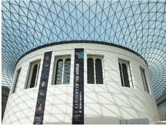
英國的大英博物館，陳列的不只是舊時日不落帝國的霸權，還有盎格魯薩克遜人自傲的民族特性。