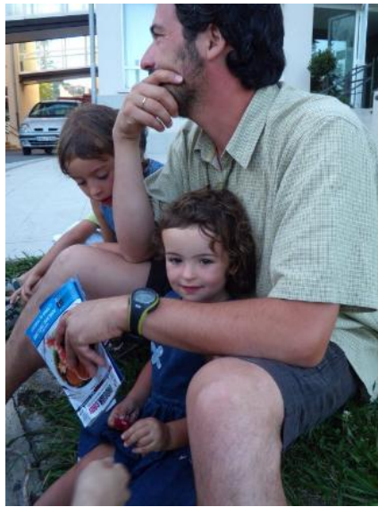
當褪去一切外在的華麗耀眼，西班牙洗鍊出歐陸世界最重視的珍寶——人，和家。