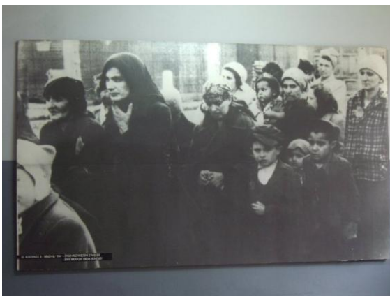
波蘭見證了歐洲最慘淡的兩次世界大戰和猶太屠殺，其境內的集中營儼然是一部人類血腥史的博物館。（照片