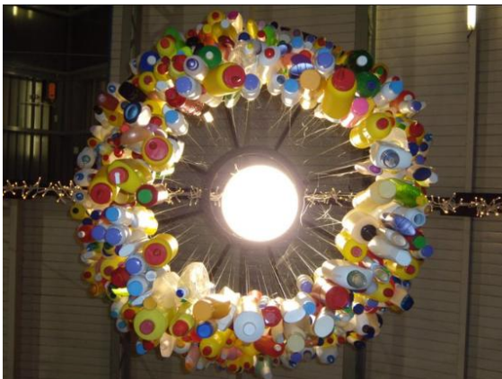
長期與海爭田的荷蘭，在環境限制下，往往展露謙卑的創意和設計。