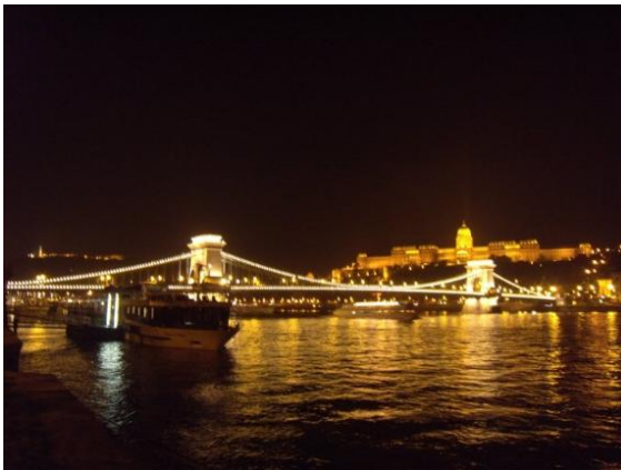
鍊橋下的多瑙河，將匈牙利的首部分為富裕的布達，和落魄的佩斯。兩岸政經的懸殊是歐洲其他都市的借鏡。