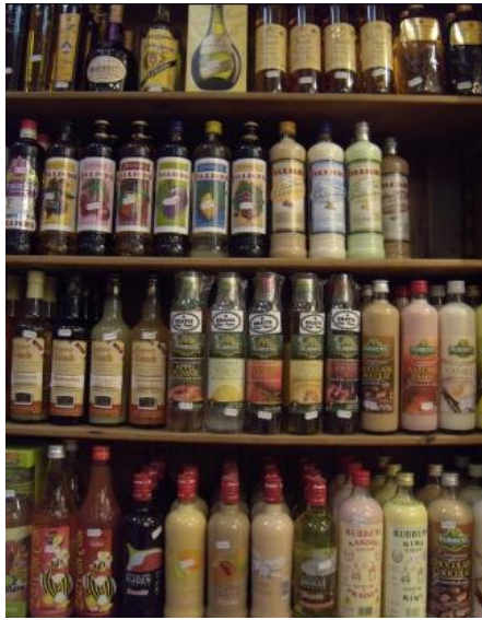
以法蘭德斯和法北結合而成的（搖搖欲墜的）比利時，以多樣的調味啤酒打響名號。