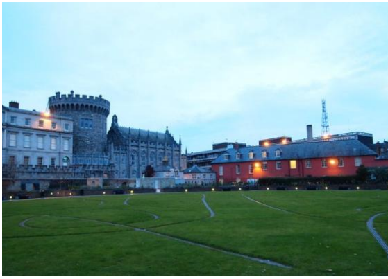
愛爾蘭的城堡和行政機關不見富麗堂皇，只有掛了歷任首相的民主之牆，和歌頌獨立革命的篇幅。