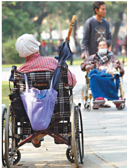
政府應重視老人福利與長期照顧居家服務，因應老化人口眾多的社會。

若台灣能夠提供良好的安養福利，便可逐漸縮減對外籍看護工的依賴，而非嚴格地執行檢測標準。減少仲介、雇主與外籍看護間的勞資糾紛，並提供補救措施於看護回國空窗期間。衛生署的長照中心應適度推廣長期照護的補助方案，避免讓老人議題遊走在各政府單位的模糊地帶，從中年開始規劃到老的福利政策，投入資源替平均越來越高齡的社會鋪好基石。