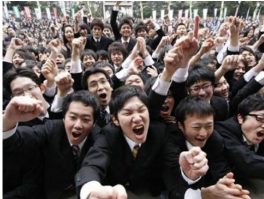
報考公務人員成為社會新鮮人追求的理想職業。

公務人員和一般民間企業職員最大的不同在於工作的穩定性，台灣的經濟基礎與工作類型多為中小企業，營運年限至多只有十幾年，在就業的保障上遠不如以政府行政業務為主，並有國家撐腰的公務人員。尤其2007年爆發的全球金融海嘯，致使國內外的經濟情勢產生重大變化，居高不下失業率數字，以及民間企業的裁員潮、無薪假措施，皆讓公職一夕之間水漲船高，包括工作安穩與福利保障等特性，使其在經濟負成長之際，躍升為社會新鮮人趨之若鶩的理想職業。