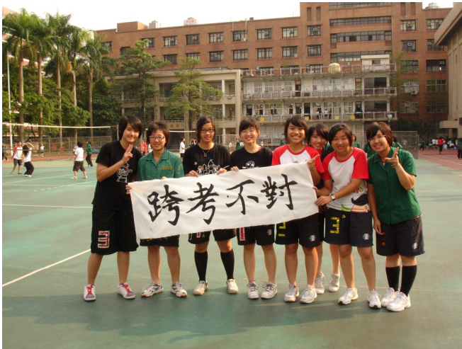
高三排球四對四比賽，隊名取名為〈跨考不對〉。

從不會打、會接球到會攻擊，其實真的不容易，它需要一群很緊密的夥伴，自始至終支持著彼此，而當這一切都結束時，你也會找到一群很珍貴的朋友，一群當你在人生中喊「救我」就會毫不猶豫伸出手的人。