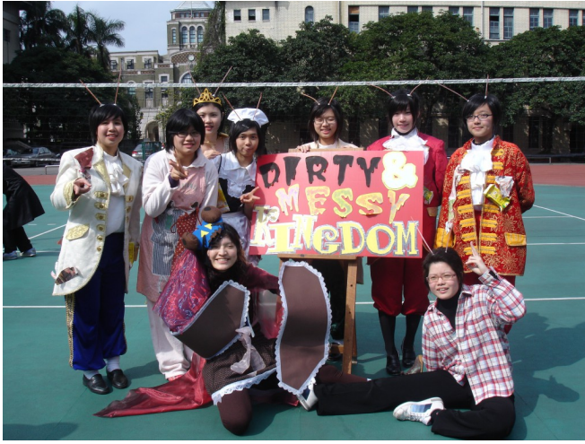
英文話劇演出《髒亂王國》，戲中各角色最後都變成蟑螂。