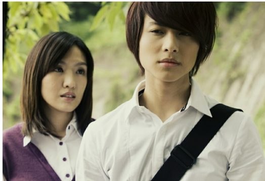
藝人王子在公視戲劇《死神少女》中與大自己10歲的老師林孟謹大談師生戀。 在現實生活中，師生戀則備受爭議及討論。

此外，師生戀關係如何定義、師生戀是否就是「發展不當親密關係」、何謂「不當親密關係」，其中的價值標準又該由誰來判斷，可說是一個模稜兩可、充滿不確定性的法律問題。