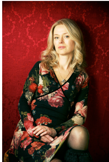
瑞典作家瑪莉亞·恩尼斯坦文字細膩感人，擅長刻畫人性的善與惡。

運用一般犯罪推理小說的「謀殺」為題材，故事一開始就安排委託殺人案件出場，巧妙地從「請你幫我殺了他」轉為「是誰幫我殺了他」，讓讀者陷入「兇手是誰」的推理路程。但找出兇手並非整部作品最核心與最精彩的部份，隨著劇情進展，埋藏於殺人案背後的人性醜惡才是整部作品的核心議題。作者瑪莉亞·恩尼斯坦以犀利的筆鋒，深掘人性的靈魂、對愛的渴望、種種生命的痛苦以及心中隱藏的謊言。