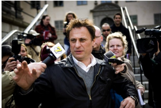
男主角布隆維斯特扮演極富正義感與推理能力的雜誌社記者。

另外電影無法完整呈現小說的精彩佈局，尤其以推理犯罪小說而言，如何在故事簡化與角色取捨的情況下，仍然不減懸疑刺激的精彩度，考驗著導演的執導能力。《龍紋身的女孩》在故事的鋪陳與片段取捨之間，成功掌握大致的主軸，但礙於時間的考量，推理過程的簡化與懸疑氣氛的不足，確實有損精彩度，實為可惜。