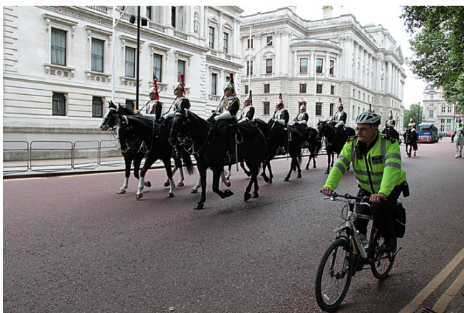
皇家隊伍與自行車、行人一起走在寬廣馬路上。