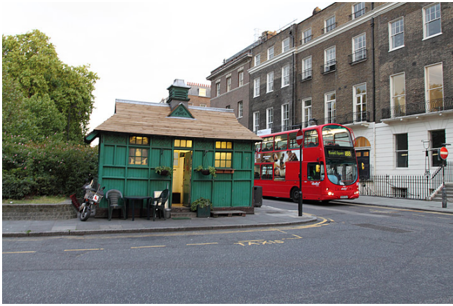
紅色巴士穿梭倫敦市區鄉間，讓整個城市色彩好繽紛。