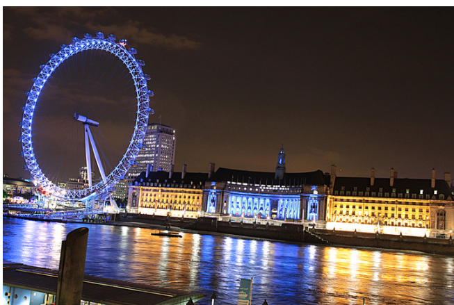
千禧年建造的倫敦之眼因為太受歡迎，一再延長拆遷時間。