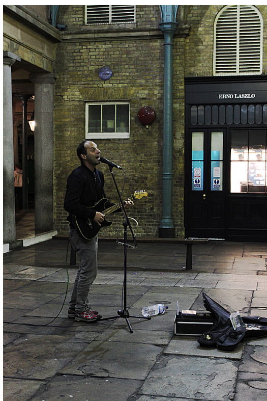
街頭藝人忘情地唱著，藝術表達從不受拘束。