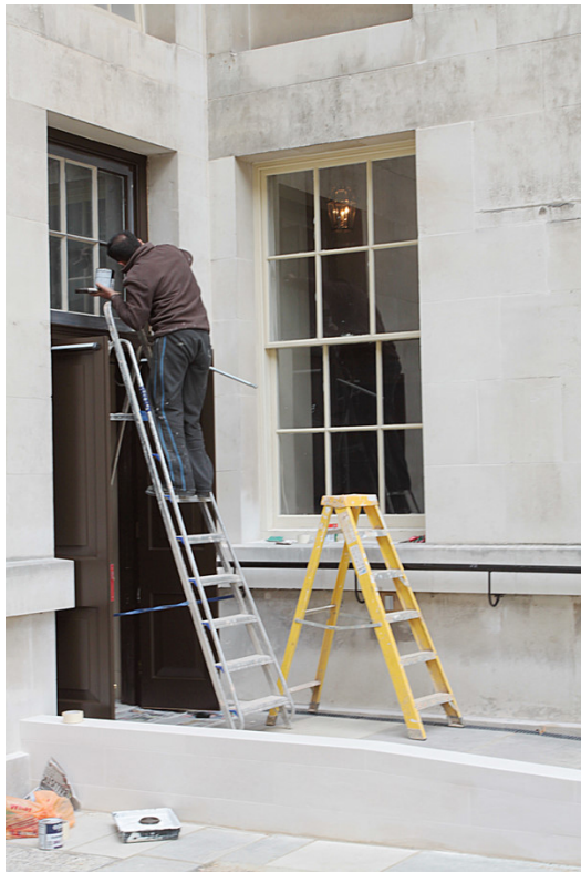
平凡的房子、簡潔的設計、用心的工人。