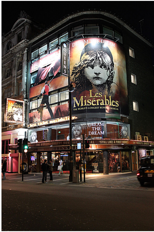
劇場是倫敦重要的精神支柱，受歡迎的劇院都有自己的招牌戲碼。