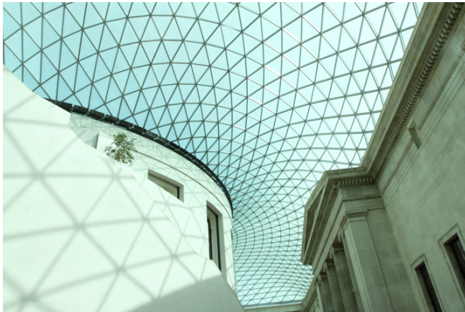
從建築到館藏，大英博物館無不震懾全世界。

在倫敦，每個人都能找到想要體會的一切。在博物館見證世界史，在街頭聆聽藝術；和皇家馬車並街而行，漂蕩在泰晤士河微醺；或是單純地凝視街道，在平凡中發現驚喜。白天夜晚，倫敦引領著旅人，探索不同層次的美麗與感動。