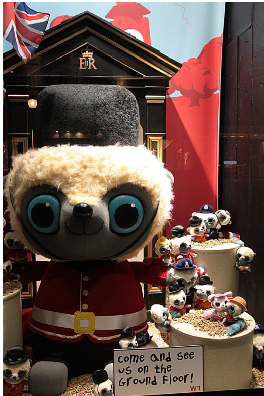
英國人把皇家紅衛兵作成各種娃娃，一起守護著這片土地。