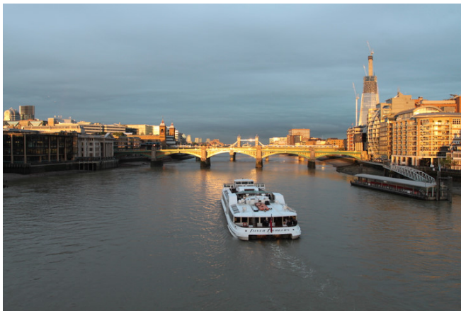
泰晤士河畔，陽光引領著方向。