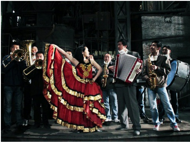
穿著大紅洋裝的歌者與樂隊在廢棄的煉鋼廠裡高歌，看起來相當突兀。