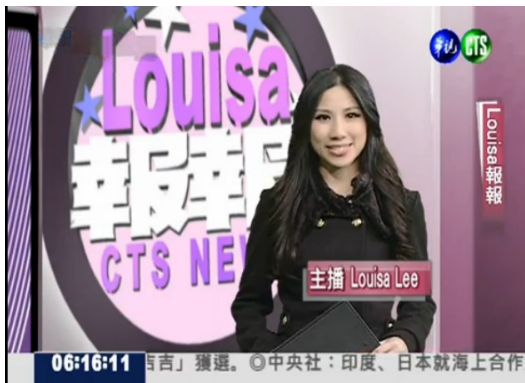
「Louisa 報報」播報畫面。

她曾經是ICRT電台的主播之一，從報路況開始漸漸成為有自己節目（The Weekend Buzz）的主持人。她也有在Animal Planet當過某一節目製作人，在美國的求學階段也曾在FOX電視台和華納在聖地亞哥設立的子電視台實習。這麼豐富的學習與就業經驗讓她的一生格外精彩。