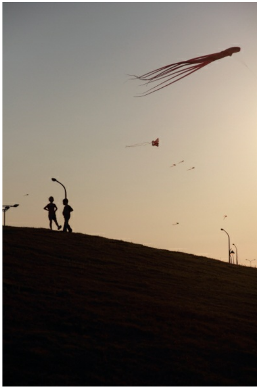
書中八位作者都極力傳達，要拍攝那些自己感興趣的東西，而不是那些所位應該拍的。