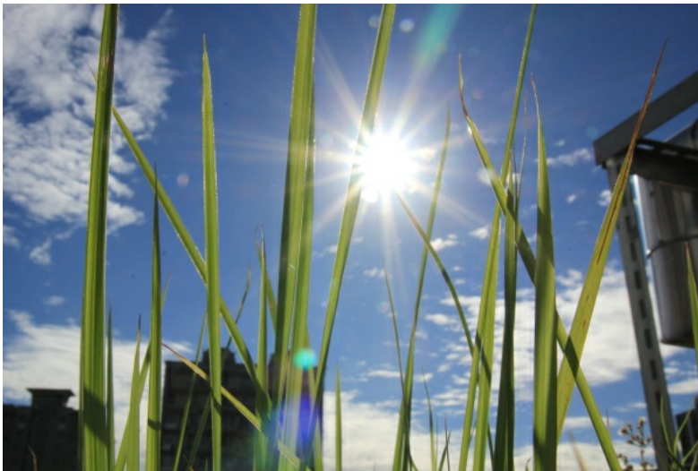
光線的掌握是攝影裡最重要的元素之一。

購買一台傻瓜相機〈Point-and-shoot camera〉，還是一台數位單眼相機〈Digital single-lens reflex camera〉？這幾乎是所有剛踏入攝影的人都要面臨的問題。在運動攝影及紀實與新聞攝影有二十年以上的經驗，並獲獎無數的專業攝影師鮑勃·馬丁，從攝影最基本的要素為出發，由淺至深的談起如何買一台相機到如何使用一台相機，從攝影基礎到進階技巧，以及如何拍出更多不同風格，屬於自己的照片。