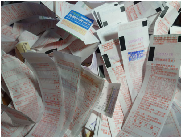
消費時拿到的發票累積下來相當可觀。

經常於超商消費的消費者一定有發現，結帳時從店員手中得到的消費憑證——統一發票，自去年（2011）12月19日開始全面改為電子發票，消費者可憑開立電子發票店家所認可的載具紀錄發票號碼，開獎後店家會通知得獎訊息，一來節省消費者對發票的時間，同時也能減少發票使用量。