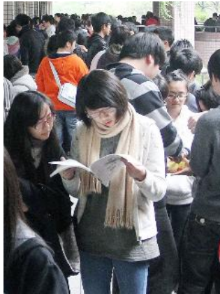
一年一度的大學入學考試，充滿應屆考生。

大學學科能力測驗（簡稱學測）將在今（101）年一月十七號正式舉行。學測是台灣高中生進入大學的第一道門檻，暑假時還會有另一次指定科目考試（簡稱指考），可以提供學測失常的考生一次新的機會。不過隨著大學部分科系開始將學測成績作為指考門檻，出現「學測綁指考」現象，使得考生陷入即使指考分數再高也無法填志願的窘境。