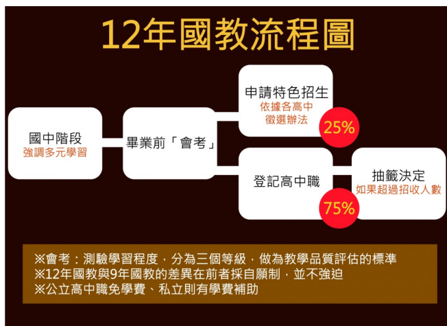
12年國教強調免試入學，但依然保留25%的特色徵選人學機會。

十二年國教期望讓更多學生從高中以前，可以接受更完善的教育，以提升競爭力。這項政策除了規定公立學校免繳學費、私立學校學費將獲補助外，也規定全國75%以上的學生免試入學，僅有25%的美術班、數理資優班等，能以特色招生的管道入學。這些策略除了屏除學生求學的經濟負擔外，也期望減輕他們的課業壓力，讓每個孩子都能夠適才適性地發展。