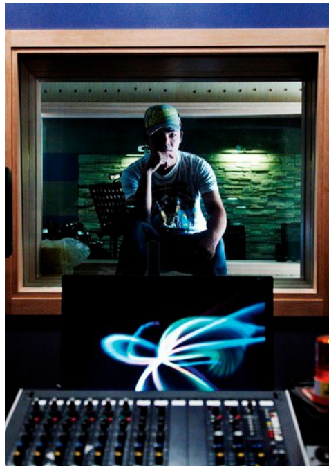
蘇通達在推出《我身騎白馬》專輯後，被譽為台灣音樂鬼才。