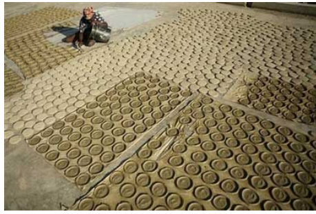
海地因為糧荒，出現了名為「泥餅」的食物