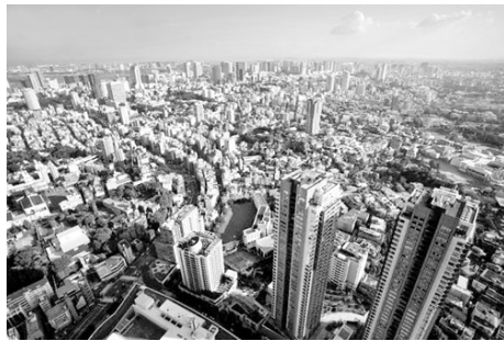
日本經歷長達十年的經濟衰退，到現在還未恢復。

石竇嚴厲的批評美國是在犯「反人類」罪，也是歷史上最大的屠殺，透過炒作糧食、哄抬價格，將貧窮人民的生命視如草芥，只為賺取一己利益。這樣的行為將導致眾叛親離，以後每個國家都會跟美國保持距離。