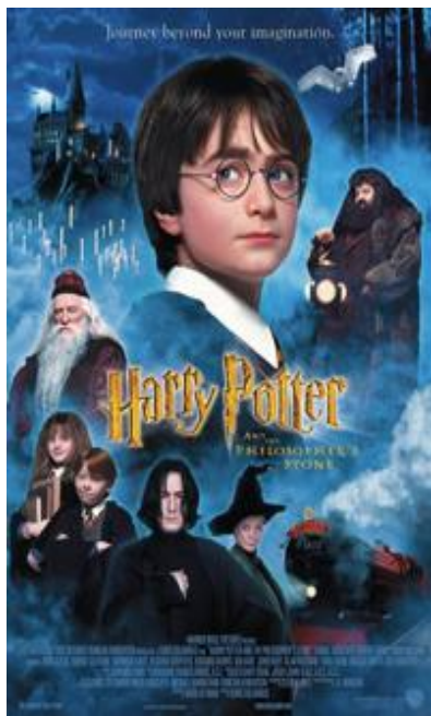
第一次跟學校一起去看轟動當時的哈利波特電影，《哈利波特與神秘的魔法石》。

今天的心得：令人開心的並不完全是看見書中的一切歷歷在目，包括了和同學們一起享受看好片的喜悅，還有在萬聖節之後又有理由可以打扮搞怪的機會。究竟在往後上映的哈利波特系列電影，我們是否還可以像今天這樣，大家一起歡樂的看電影呢。真令人期待。