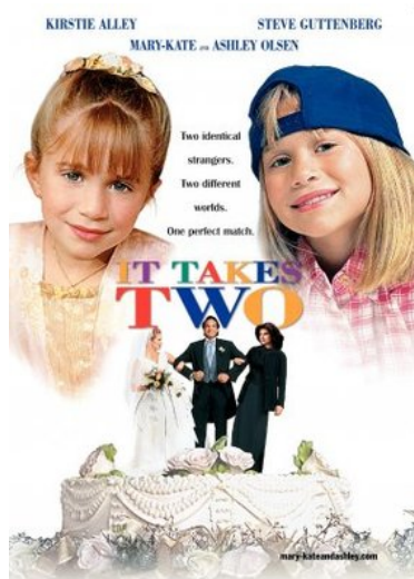
第一次到戲院看的外國片，由歐森姊妹主演的《天生一對》。

也因為第一次認真看真人電影，莫名其妙有個錯誤認知，就是劇情中飾演的父女的人在現實生活中也是父女關係，害我後來看其他部電影的時候一直覺得奇怪為什麼看到同一個爸爸多了那麼多個兒女，還好在暴露出這樣愚昧的觀念以前就想清楚了。我喜歡這次的溫馨，不只劇情溫馨，跟家人一起歡笑更是溫暖。