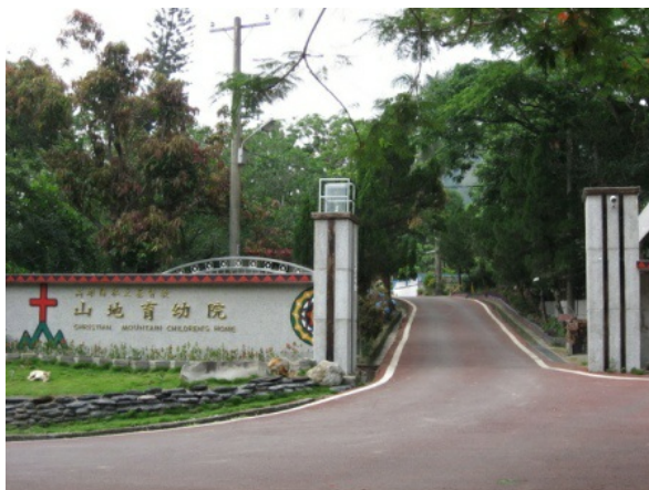
位於高雄縣六龜鄉的山地育幼院，至今已有近50年歷史。

今年夏天，透過平日課輔的學校主任介紹，我來到了充滿歷史的六龜育幼院。這是一個簡單卻處處充滿愛的地方，牆上、走廊，隨處可見的是小朋友的童年塗鴉及作品，陪伴了許多人成長，也孕育出許多夢想。