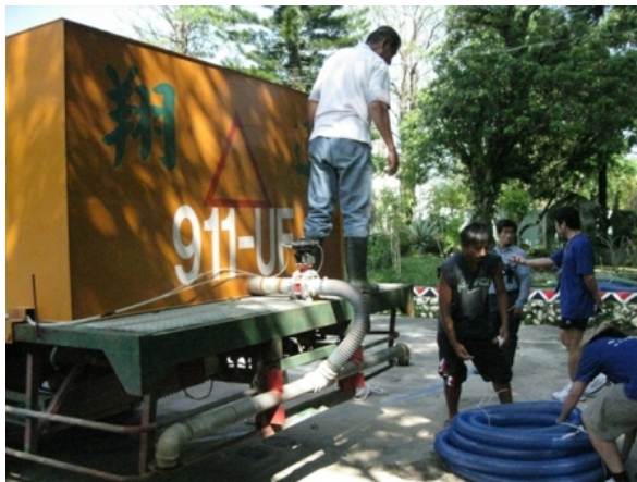
八八水災時，志工幫忙運送物資到六龜。

開始慢慢了解，老師為什麼會如此戒慎恐懼，而年長點的院童們又為何會對颱風感到緊張。我想，對他們來說，當年風災的記憶永遠無法消除，身處在一個敏感地區，每一次的狂風暴雨，都會勾起心中的不安，深怕再來一次莫拉克颱風，家園就會不見。回想起在去的路上，所感受到的衝突感，我找到那連結了，原來，道路可以重建；產業可以重新開始；山林可以重新復育，但留在經歷過的人心中的陰影及恐懼，卻是不論多久都難以消除的。