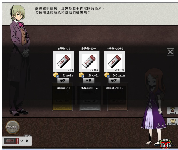
想要得到特殊卡片，就得先有抽獎券。

每個角色都有不同的戰鬥能力、也有不同的劇情，玩家如果想要特定的角色，就要考驗自己的運氣。抽獎券可以透過每日獎勵、或是邀請新朋友加入遊戲、達成系統給予的條件等方式取得，不過每日獎勵拿到抽獎券的機會少之又少，所以最快速的取得方式，就是花錢買，一張要價台幣約33元。當然，不保證抽到什麼東西，要是沒有抽到想要的卡片、又不願意放棄，也只好再去買點數來購買抽獎券了。