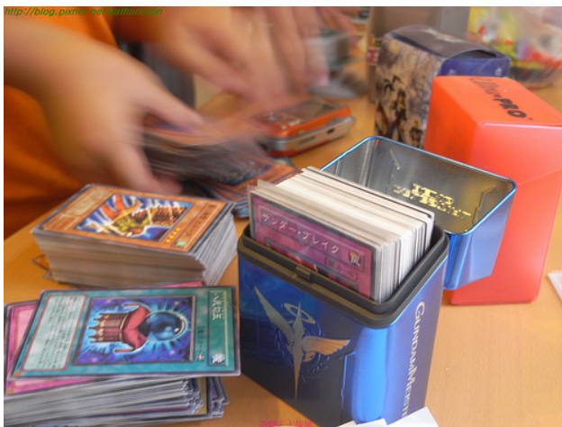
風靡台灣十年的遊戲王卡，是多少男孩與男人共同的回憶啊！

遊戲王卡牌遊戲的流行，證明了小孩的消費力，一張普通的卡牌價格不算太貴，人人買得起，但累積起來也相當可觀。順帶一提，因為日本原版授權的牌價格較高昂，台灣也有一些店家發行自製的卡片，但有不少男孩會因為對方拿的不是原版而嘲笑對方，藉此證明自己有較強的消費能力，也就是彰顯自己比較有錢。套用到今天網路卡牌遊戲上，也常有玩家在遊戲的公開頻道上，表示自己花了多少錢、抽到多少高級角色，就像其他網路遊戲穿著「神裝」、或是只有商城才販賣的時裝道具一樣。