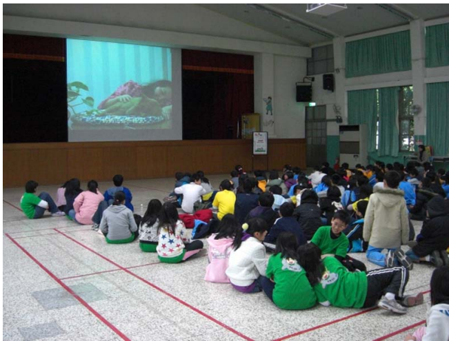
「圓缺之間」身心障礙者影展走入校園。

除了針對身心障礙者做的一些訓練、輔導外，對於社會大眾的生命教育，也是鄭信真所重視的。廣文教基金會從2001年起，每年都會舉辦「圓缺之間」身心障礙者影展，其中展出的紀錄片來自世界各地，把這些影片帶進小學及國中做生命教育，介紹他們認識身心障礙者，也透過身心障礙者奮鬥的生命故事，讓他們在感動之餘，也能學習到如何關懷他人，以及對待身心障礙者的態度。