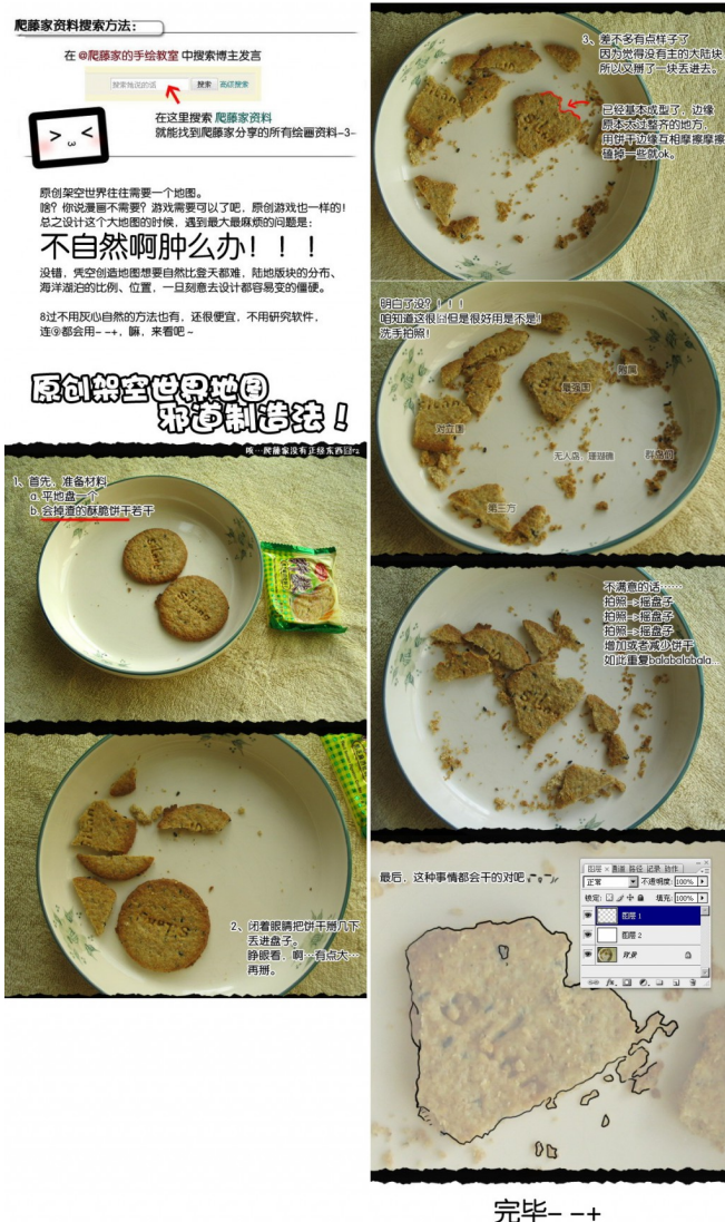
設計一個世界地圖並不簡單，許多作者都曾為此所苦。

寫小說跟國中作文不一樣，跟日記網誌更不一樣，我得研究如何設計場景、為角色塑造個性、如何架構出世界觀等等，接著嘗試把這些用文字一一表現出來，還必須顧及文章的流暢度。光是這些拉拉雜雜，就令人暈頭轉向，更別提如何掌握說故事的節奏、埋設伏筆，讓讀者覺得好看了。最後，我發現即使寫了大綱，也不見得派得上用場，因為很容易寫到一半，就想要變更某部分的設定，修修改改的，最後才發現文章已經走型。