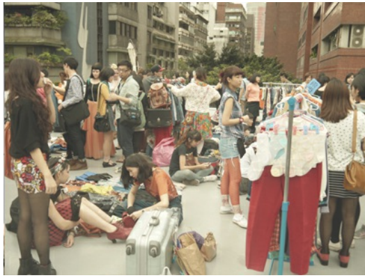
市集是當前創作人集結的熱門管道，而市集也多为透過網路宣傳。