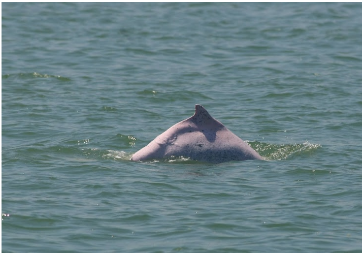
現在所見的白海豚很多都如同照片中所攝的模樣一般，露出凹陷的身體。

換句話說，白海豚的族群其實也跟沿海環境息息相關。隨著臺灣的工業發展，越來越多的汙染沿著河水、海水一起流到台灣沿海，造成台灣沿海漁業無法像過去一樣捕到這麼多的漁獲。一旦漁獲銳減，漁民們就必須想盡辦法讓自己捕到的漁獲維持過去的水準，因此衍生出來那些將一地資源全部掠取殆盡的捕撈方法。