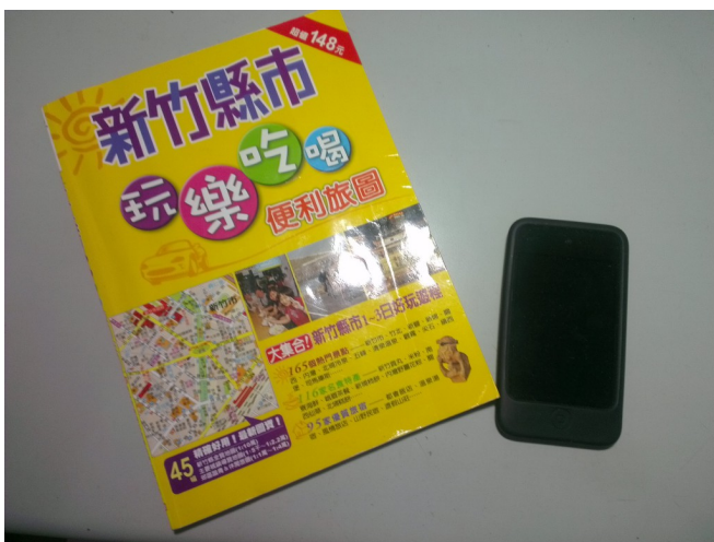
智慧型手機比傳統旅遊書小了幾倍，但資訊卻比旅遊書更豐富。

E-mail文件、觀看股票最新動態，上網觀看YouTube影片、玩遊戲等，從前只能在電腦上才做得到的事情，現在只要智慧型手機就可以完成。