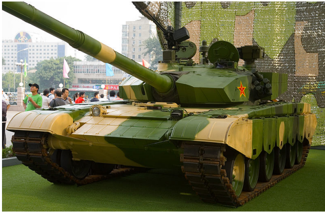
中國新一代主力——99式戰車，未來陸軍不可或缺的裝備。

發就一直沒有停過。儘管中間遇過文革，整個國家幾乎停擺，但是69式、80式系列戰車一直到最新的第三代99式戰車，發展幾乎未曾間斷，中國在這些研發的過程中獲得了許多寶貴的技术。除此之外，中國空軍也擁有為數不少的中大型運輸機，對於陸軍的境外作戰能力也有大幅提升。