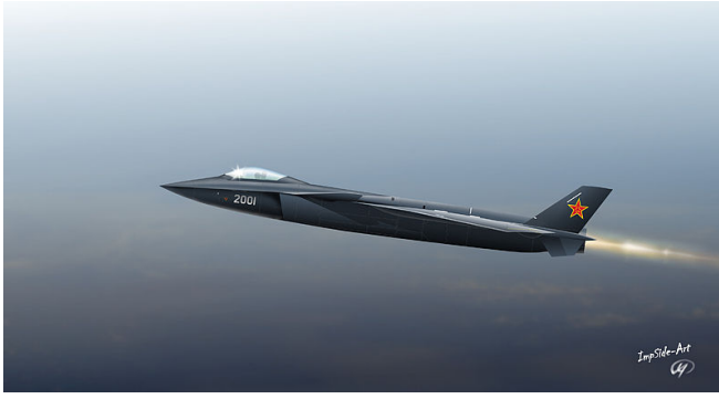
殲-20側視想像圖。

目前雙方戰機的戰力並未有太大的差距，但是台灣從軍購案遲遲因為各種因素未過，乃至於國軍士氣的低落，在未來可能會成為兩岸空軍軍力失衡的因素之一。加上新一代戰機的採購一直未有定論，台灣的空中優勢能繼續維持多久沒人說得準。