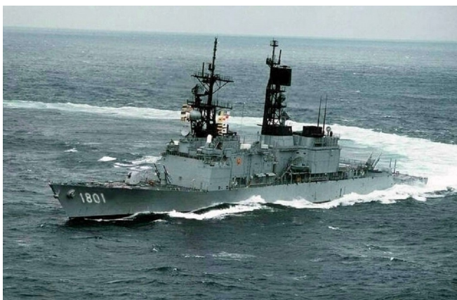
紀德級驅逐艦，基隆號。

台灣海軍最近幾次的重大更新，包含1993~2004年間陸續成軍的四艘成功級巡防艦，以及2005~2006年間由美國陸續移交給台灣的基隆級驅逐艦。這幾艘雖為美國的退役艦艇，但是對於台灣而言，仍為相當強大的海上軍力。相較於水上艦艇，台灣的潛艇戰力則相當薄弱，儘管美方之前曾有意願出售八艘柴電潛艦，但是礙於軍購案屢次被封殺以及潛艦國造等爭議，因此遲遲未見成功。除此之外，台灣現有四艘潛艦，其中兩艘為二戰時期的美軍柴電潛艦——海獅級，對於海獅的狀況軍方一直保持低調，對於是否可以作戰仍為未知數；而另外兩艘為1980年自荷蘭購入的劍龍級，持續服役至今，而2012年時向美軍採購的反艦飛彈也已經試射完畢，預計2013年完成戰備。