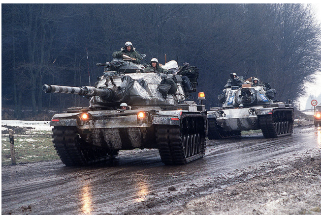
M60為第四代巴頓戰車，是台灣向美國購買的戰車，卻是1960年代美軍所使用的產品以及衍生品。

在另一個重點—裝甲車輛，兩岸依然呈現出很大的落差。台灣陸軍的主力戰車從早期的M48，後來升級成CM12，以及與GM合作研發的CM11和自美國買入的M60TTS，都是1960年代美軍所使用的產品以及衍生品，許多防護與武力設計早已過時，但是國軍卻遲遲未有下一代戰車的研發行動，僅有前朝扁政府時期推動的雲豹裝甲車計畫。如此武力在面對中國裝甲部隊時，將會形成一場屠殺。