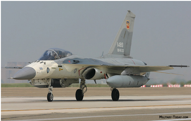
F-CK-1，經國號戰機。

台灣空軍現有軍力多為第三代戰機，包含F16 A/B、幻象2000-5以及F-CK-1，還有較為舊型的二代F-5E。近年來空軍數次向美方表達購買F-16 C/D的意願，但是被美方以愛國者飛彈以及空中預警機預算的不明確為由而拒絕。軍方也曾向美方表達購買F-35或是二手F-15的意願，但是基於中國若是对台戰爭將會優先摧毀機場等設施的前提下，美國也拒絕此項提案。近期通過提升空軍戰力的提案則有AIM120、AGM84的採購，以及數架E-2空中預警機的升級案。