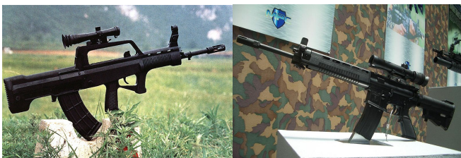
雙方軍隊主要步槍，左為解放軍QBZ95，右為台灣T91。

中國陸軍現役約有一百二十五萬人，其中約有三分之一，也就是大約四十萬人，部屬在台灣海峽的範圍之內；而台灣陸軍現役約有十三萬兵員數，在數量上就大幅度地落後對岸。陸軍作戰時，主要看重步兵與裝甲車輛的作戰能力；而單兵武器的成本並不高，因此雙方在90年代末期至21世紀初期紛紛推出替代品，如中國的QBZ95與聯勤的T91，以取代原先使用的槍枝。