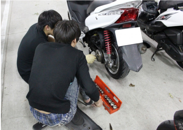
如果有困難，也能跟同學一起討論怎麼解決。