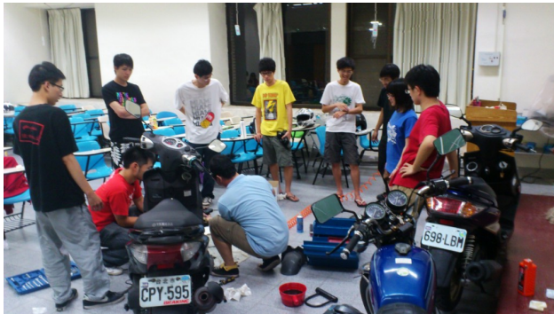
因為沒有地方做教學，只好借教室在教室裡上課。

交通大學騎乘機車的同學人數非常多，雖然在學校裡玩車的人相當少，但這些玩車人仍然堅持自己的理想，繼續投注對機車的熱情。他們能自己找整理車輛的場地，能自己動手解決自己機車的問題，也能齊聚一堂，一起聽專業的老師解說課程。