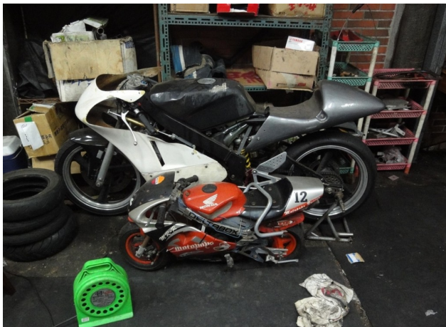
比一般機車小一號的mini bike除了能展示，也是教學時的一項好教材。