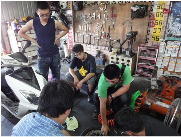
學校沒有地方整理車輛，也可以到外校的場地整理車輛。