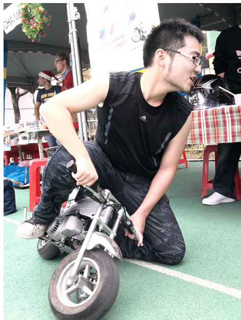
擺攤時，許多人沒見過的mini bike搶盡路人的目光。