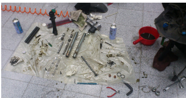
上課時分解的零件散落一地，也讓學生看到平常看不到的內部構造。