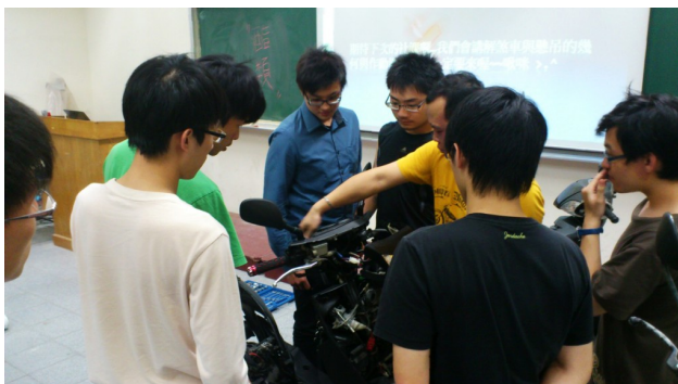
上課時，同學聚精會神地看著老師示範，希望能多學習到關於機車的知識。