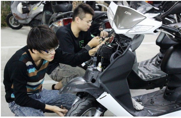
同學認真地整理車輛，希望自己動手解決機車的問題。