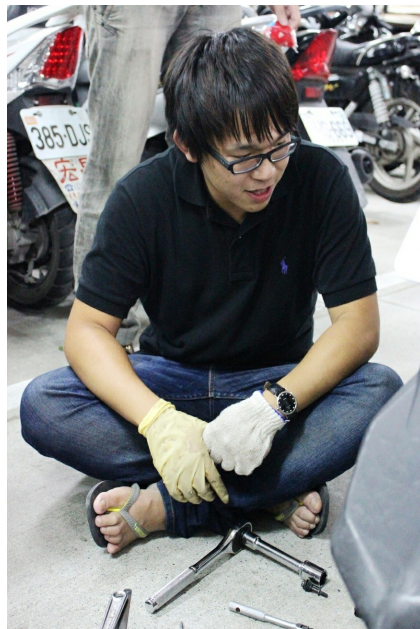
遇到瓶頸時，休息一下繼續動手也許問題就解決了。