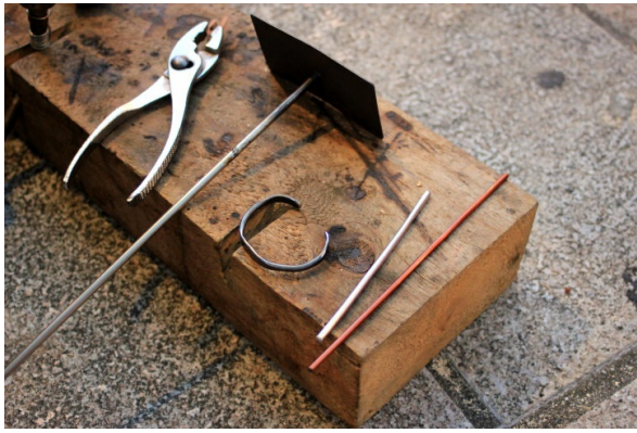
紅色的銅材質軟、價格較低，銀色的不鏽鋼條則較堅硬、價格較高。 萬仁盛將金屬加工、塑形後，製作成各式各樣的首飾、工藝品。