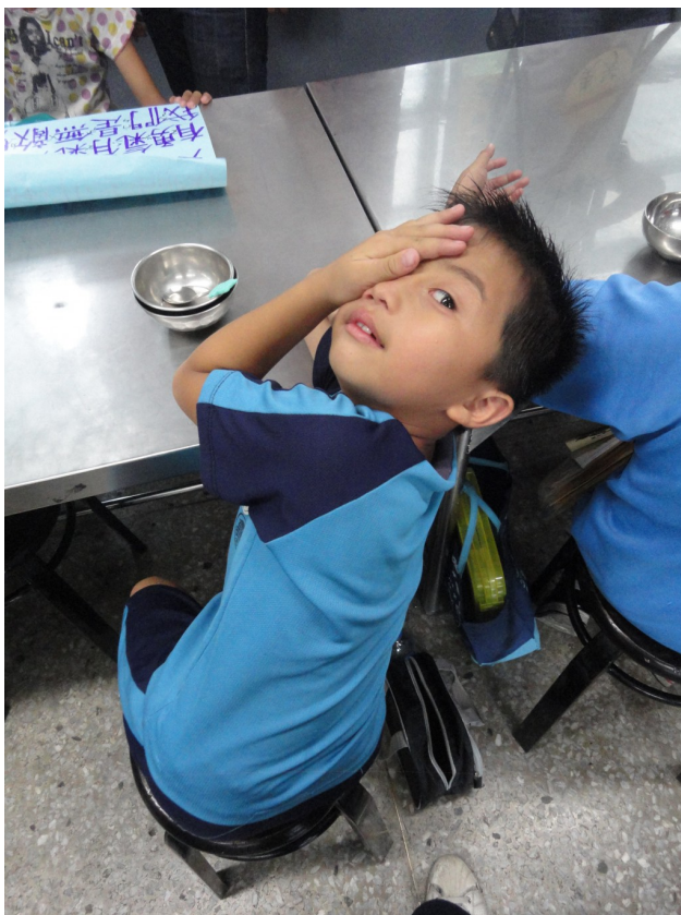
令隊輔們頭疼的鬼抓人遊戲、走廊百米賽跑的常勝軍。

但在始業式之後，許多小隊的活動與課程都在一種不受控制的場面中進行，有些小朋友有屬於自己的遊戲規則，對於關主的解說如耳邊風，左耳進、右耳出，或者跑到關卡旁的遊樂設施玩起單槓、溜滑梯，只能讓願意配合的小朋友進行活動。而課程進行時許多小朋友也跑出教室與隊輔們玩起鬼抓人的遊戲，然而被抓回來的小朋友趁隊輔一不注意就溜煙地跑走了，鬼抓人的戲碼只好一再地上演。在小隊時間進行晚會表演練習時，只見活潑好動的小朋友把走廊當成跑道比起百米賽跑，而小隊教室只剩隊輔與隨輔帶著一兩個小朋友練習待會要表演的舞蹈。