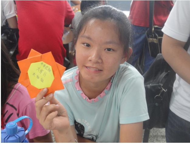
只要深刻體會過，便永遠不會忘記那種被記得的感動。