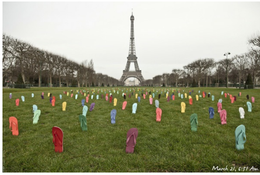
琳瑯滿目的夾腳拖成為表達自身獨特個性的新方式。

包頭鞋：此種鞋款的優勢就在於穿脫方便，也不用穿襪子，如果搭配長褲就看不出來是拖鞋。最為有名的鞋款應該就是由前總統布希穿上之後一炮而紅的園丁鞋，此鞋款式是由塑膠製成的，鞋子前方包住整個腳掌腳背，而腳後跟是沒有包覆住的。另外，德國大廠牌勃肯鞋也專門推出這種包頭鞋，相較於布希鞋的不同，勃肯鞋的特色在於合腳的軟木和橡膠材質鞋底，從1980年代起，勃肯鞋受到許多需要長時間走動的工作人員青睞，於是越來越流行。除了布希鞋，勃肯鞋之外，近年來在上班族跟學生族群當中也流行一種懶人皮鞋，這種懶人皮鞋的材質跟一般皮鞋沒有差別，但是外表設計的跟拖鞋一樣是後腳跟沒有被包覆住的，對於長時間需要穿皮鞋的族群來說是非常容易穿脫跟通風的，於是也流行了起來。