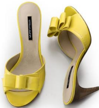
即使價格昂貴，但是高跟拖鞋一直是女性同胞們鞋櫃裡不可或缺的角色。

高跟拖鞋：為了搶奪女性市場這塊大餅，拖鞋也可以設計成跟高跟鞋一樣，楔型鞋、細跟、厚底等等的高跟拖鞋在近年來大放異彩，其中因為後腳跟沒有包覆所以比一般高跟鞋要舒適的許多而且高跟拖鞋的款式花樣可以說是相當的百變，一雙知名品牌的高跟拖鞋上面可能有雕花或鑲鑽，而這些價格昂貴的高跟拖鞋卻也讓女性同胞愛不釋手。