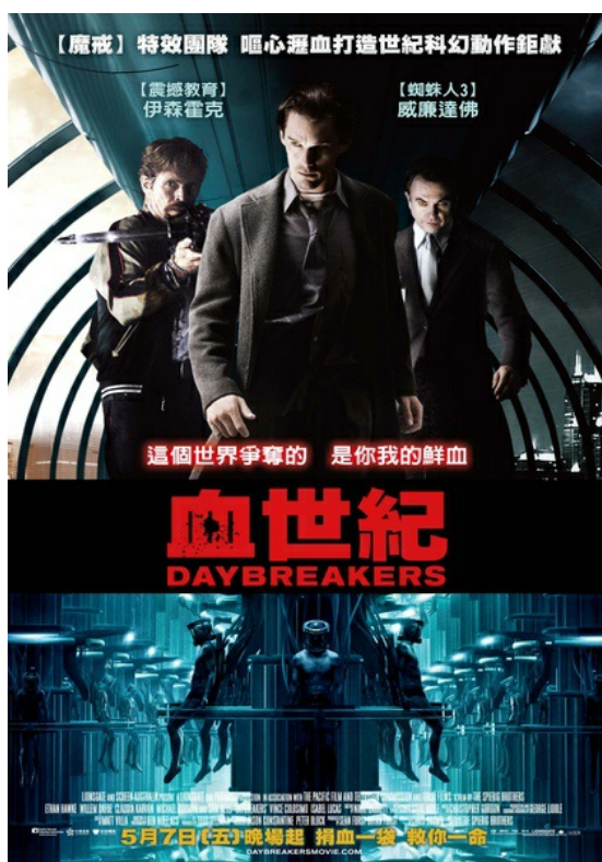
《血世紀》電影海報。

一隻吸血蝙蝠，一場意外的瘟疫，改變了全人類的生活，故事背景設定在2019年，你可以擁有源源不絕的體力、聰明頭腦，更棒的是你能青春永駐，並且長生不老，想實現這些完美的願望只有一個代價——變成吸血鬼。這些不可抗拒的誘惑，讓全世界的人類「幾乎」都變成了吸血鬼，僅存的人類只有兩種下場，如同牲畜被飼養，以提供的世界主要糧食——人血，或是成為全世界的獵物，只能不停地逃命。